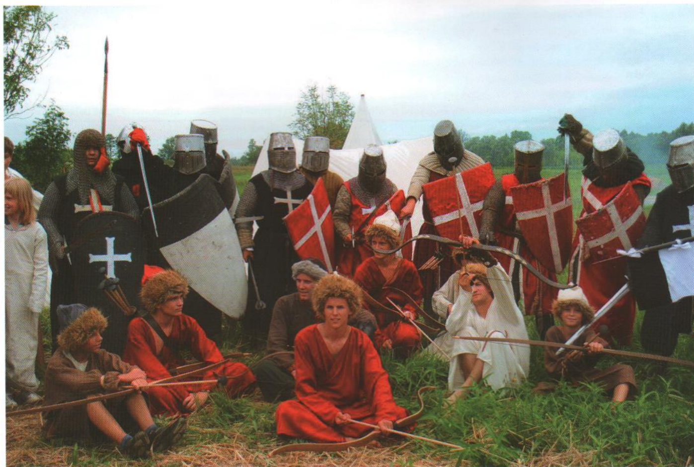
Wśród wojsk sprzymierzonych, które pomogły nam pod Grunwaldem pokonać Krzyżaków, były też posiłki tatarskie